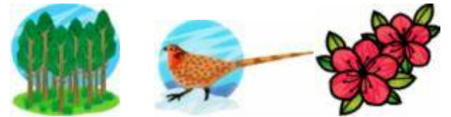
奥多摩町の木・鳥・花 [杉・ヤマドリ・みつばつつじ]