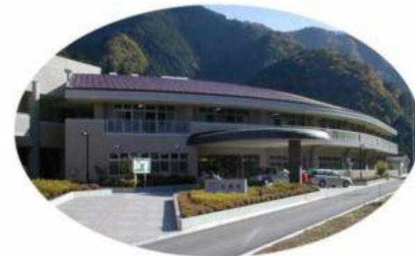
介護老人福祉施設 寿楽荘 (特別養護老人ホーム)