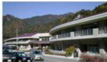
寿楽荘全景 東側面より