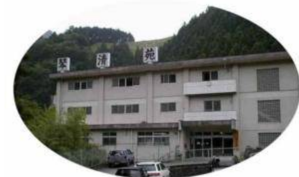
介護老人福祉施設 琴清苑 (特別養護老人ホーム)