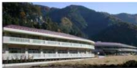
寿楽荘全景：西側面より